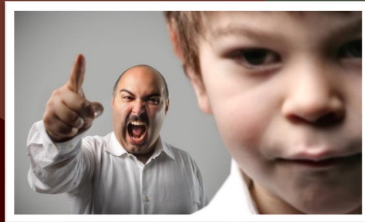
No más padres tóxicos