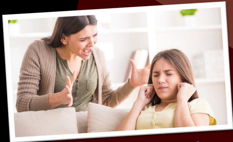
Tus hijos no te escuchan