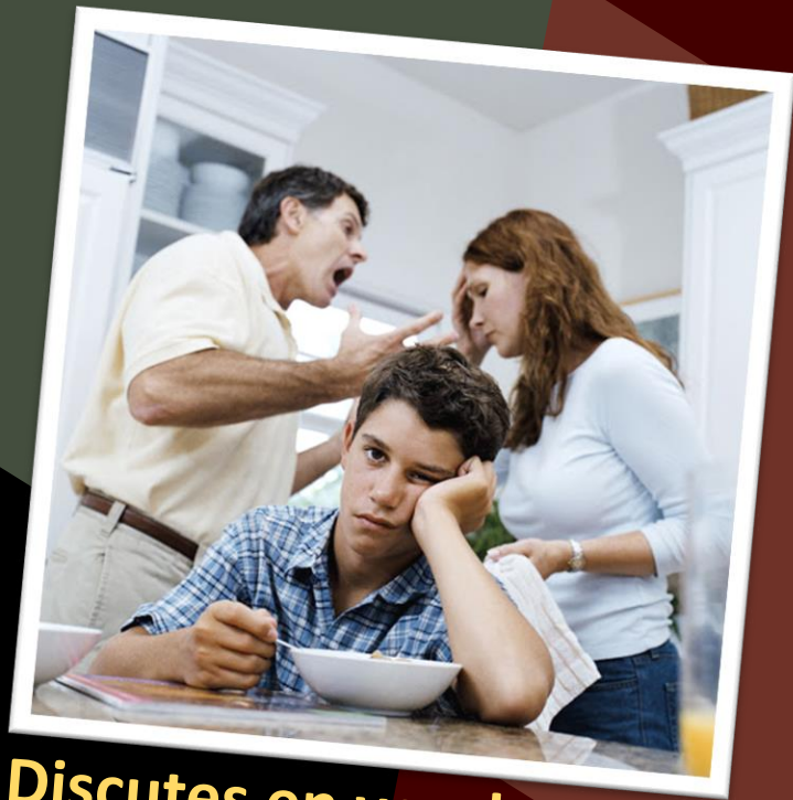
Discutes en vez de resolver