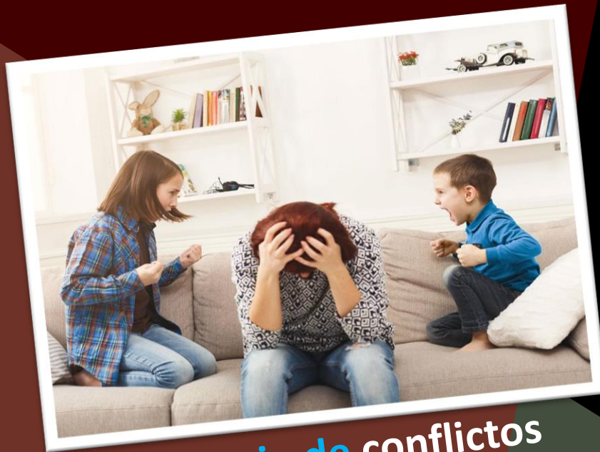
Manejo de conflictos